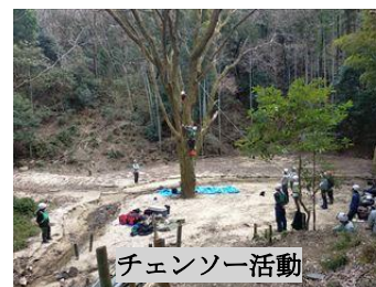
チェーンソー活動