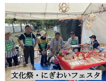
文化祭・にぎわいフェスタ