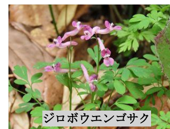
ジロボウエンゴサク