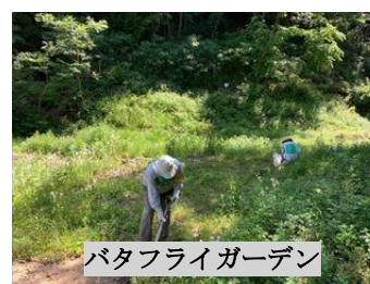
パタフライガーデン