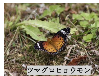
ツマグロヒョウモン