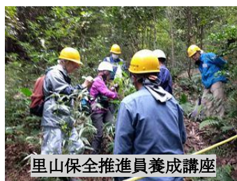
里山保全推進員養成講座